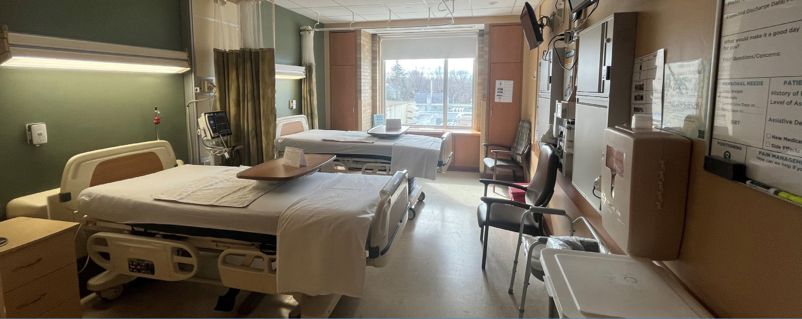
Diagrama de la habitación